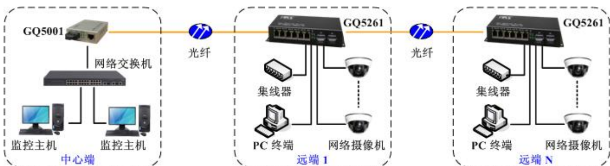
方案一：光纤多点组链型网络