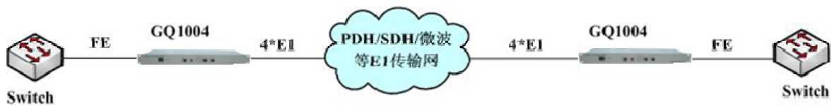
方案一：点对点组网